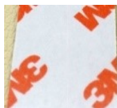
現行品テープ剥離紙

新型番(一回目) : ハイパック DH-A4-WF (RoHS10 未対応品 コニシ WF 仕様)